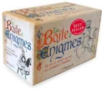
LA BOITE A ENIGMES